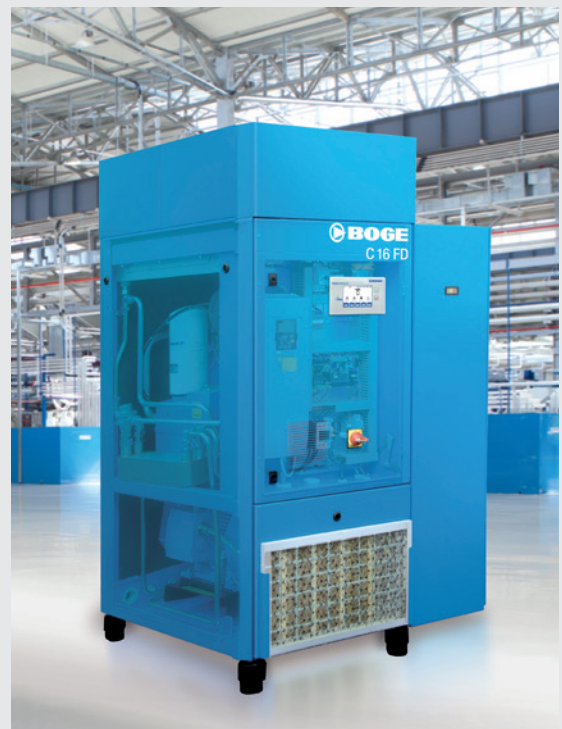
Optimal bestückt und dennoch kompakt: die C 16 FD mit integriertem Kältetrockner